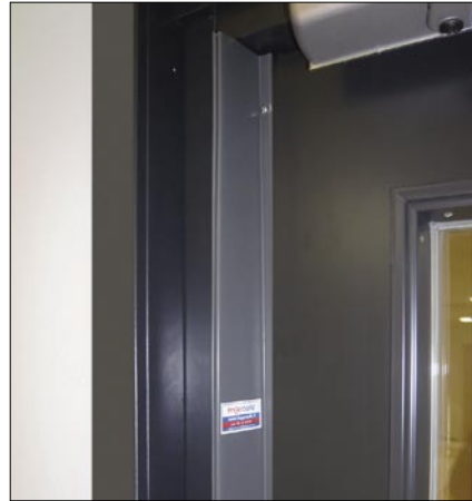
MK1A ovi suljettuna