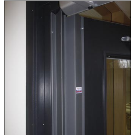
MK1A ovi avattuna