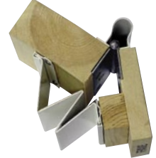
Sormisuojaat asennetaan oven molemmille puolille.

Fingersafe on oven saranapuolelle asennettava sormisuoja, jolla estetään tehokkaasti sormien joutuminen oven saranapuolen väliin. Patentoidun mekanisminsa ansiosta sormisuoja "heittää" sormet pois suljettavan oven välistä.